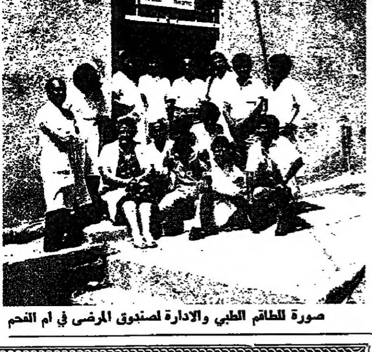
صورة للطاقم الطبي والإدارة لصندوق المرضى في ام الفحم

س - هل ثمة تعاون بين صندوق المرضى ومراكز رعاية الام والطفل في ام الفحم؟ ج - لا شك في ذلك هناك